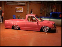
Μετατροπή στην ανάρτηση