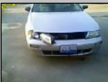
Σπασμένα φώτα ή κάτοπτρα